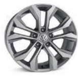
Легкосплавные колесные диски "Soho" 7J x 17 стандартно для Exclusive 2.0L