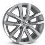
Легкосплавные колесные диски "Sepang" 6,5 J x 16 стандартно для Business 1.4L