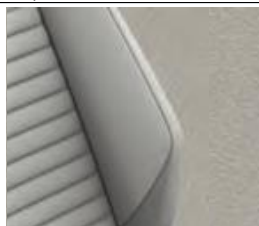
Комбинированная обивка сидений из искусственной замши/кожи светло-серого цвета