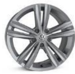
Легкосплавные колесные диски "Sebring" 7J x 17