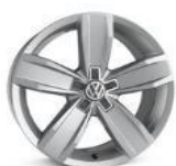
Легкосплавные колесные диски "Istanbul" 7J x 17 стандартно для Business 2.0L