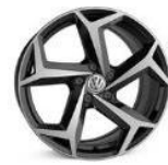
Легкосплавные колесные диски "Bonneville" 8J x 18