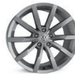
Легкосплавные колесные диски "Monterey" 8J x 18